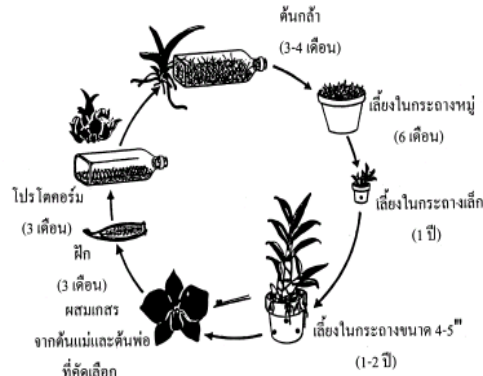
วงจรชีวิตกล้วยไม้จากการผสมเกสร

email address: kanchitthammasiri@gmail.com