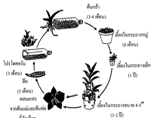
วงจรชีวิตกล้วยไม้จากการผสมเกสร

email address: kanchitthammasiri@gmail.com